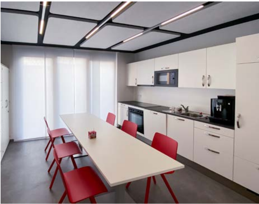
Personalbereich: Ausstattung fördert den Teamgeist

Überflutung und rückt regionale Themen in den Vordergrund.