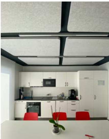
Abnehmbare Akustikpaneels im niedrigen Deckenbereich

Die Sparkasse Lörrach-Rheinfelden setzt in ihren neuen Bankräumen ganz auf individuelle Beratung und verknüpft dazu geschickt die persönliche Betreuung von Mensch zu Mensch mit digitalen Kommunikationskanälen. An einem zentralen Servicepoint werden die Kund:innen persönlich in Empfang genommen. Die Berater:innen arbeiten im Teambüro agil und flexibel zusammen und buchen sich je nach Bedarf einen nicht personalisierten Beratungsplatz. Ein weiterer Beratungsplatz mit Zugang über die SB-Zone kann unabhängig von den Öffnungszeiten genutzt werden. Der SB-Bereich ist mit aktuellen SB-Geräten ausgestattet und ermöglicht Sichtkontakt mit den Mitarbeitenden. Die minimalistische Gestaltung vermittelt Bodenständigkeit und