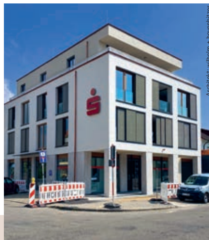
Architekt: wilhelm + hovenbaltzer

Erträge werden selbst genutzt, überschüssiger Strom wird in das regionale Netz eingespeist.