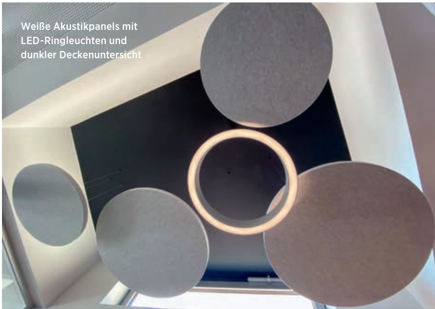
Weißer Akustikpanels mit LED-Ringleuchten und dunkler Deckenuntersicht