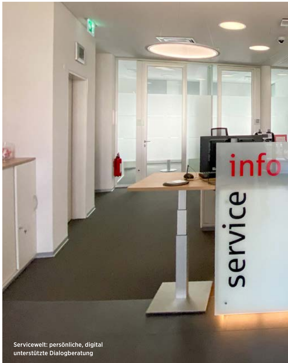
Servicewelt: persönliche, digital unterstützte Dialogberatung