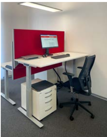
Ergonomische Teamwelt: arbeiten im Sitzen oder Stehen