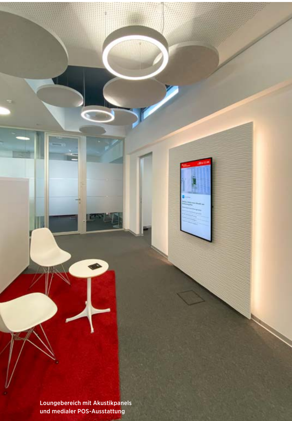
Loungebereich mit Akustikpanels und medialer POS-Ausstattung

Beleuchtung kommt wartungsfreie, hocheffiziente LED-Technik zum Einsatz. Intelligente Steuerungen und Schaltungen reduzieren den Energiebedarf zusätzlich. In die zeitlos moderne Einrichtung wurden behutsam digitale POS-Content-Systeme integriert. Sie ergänzen die Unternehmenskommunikation mit neuen digitalen Tools und sorgen für eine optimale Mischung von analogen und digitalen Angeboten. Ein wichtiger Baustein der Filiale ist der Bereich Immobilien. Hier verzichtet die Sparkasse auf mediale