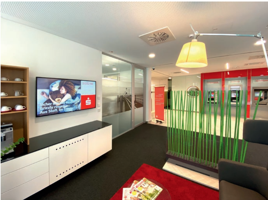
Die Espressobar für Kund:innen im Loungebereich

können die Beratenden vom Tablet oder Rechner auf einen Screen umschalten und die Kund:innen so im Gespräch digital mitnehmen. Die Mitarbeitenden können im Teambüro agil arbeiten und bei Bedarf einen der nicht personalisierten Beratungsräume buchen. Auch Kundenschießfächer und weitere attraktive Dienstleistungen gehören zum Leistungsportfolio der neuen Kressbronner Spar-