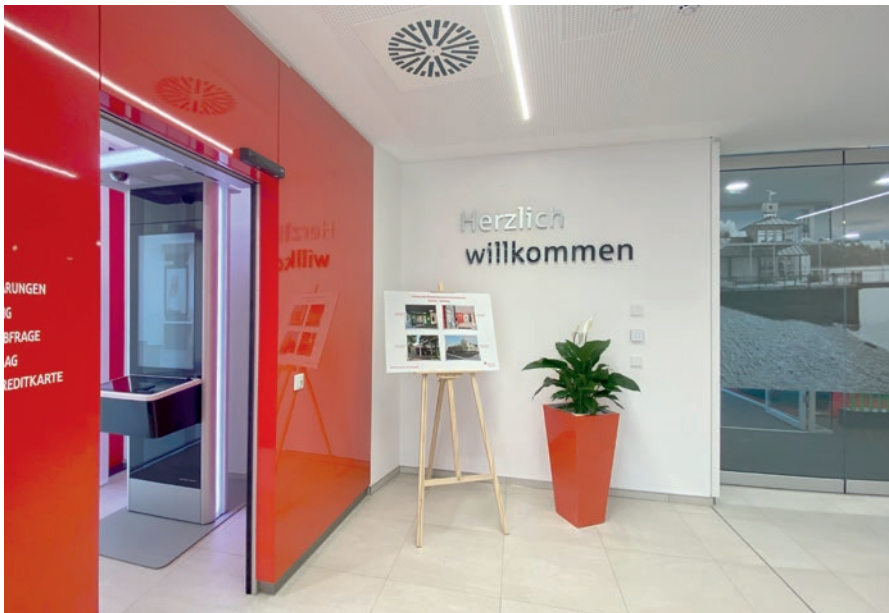
Die Livebox für persönliche digitale Beratung

Im Zuge der Sanierung haben die Sparkassenräume im EG ein völlig neues Gesicht erhalten. Eine durchgehende Glasfassade sorgt für reichlich Tageslicht und helle, natürliche Materialien gewährleisten eine hohe Aufenthaltsqualität. Alle Flächen des neuen Beratungszentrums einschließlich Neben- und Technikräumen sind barrierefrei. Durch eine geschickte Raumaufteilung mit bestmöglicher Flächenbewirtschaftung und Insze-