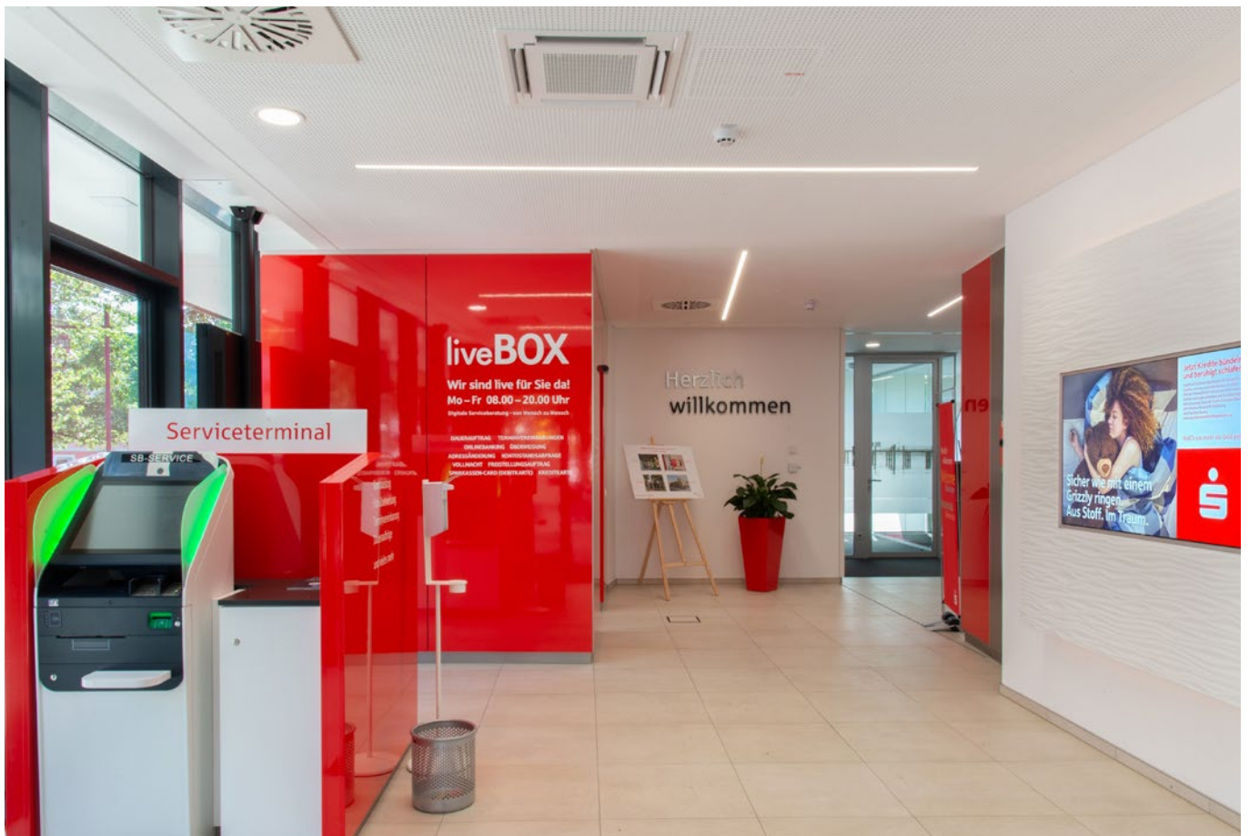
Einladend und hell: die 24-Stunden-Welt in markentypischer Gestaltung