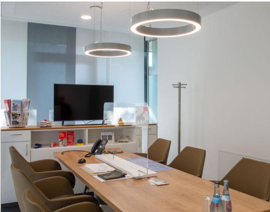
Helles, funktionales Beratungsambiente

projektbezogene Sonderleuchten nachhaltig und umweltverträglich produziert. Die hochwertige, blendfreie LED-Beleuchtung ist sehr energieeffizient und wartungsarm und erzeugt eine angenehme Atmosphäre bei optimaler Lichtverteilung in den verschiedenen Raumbereichen.