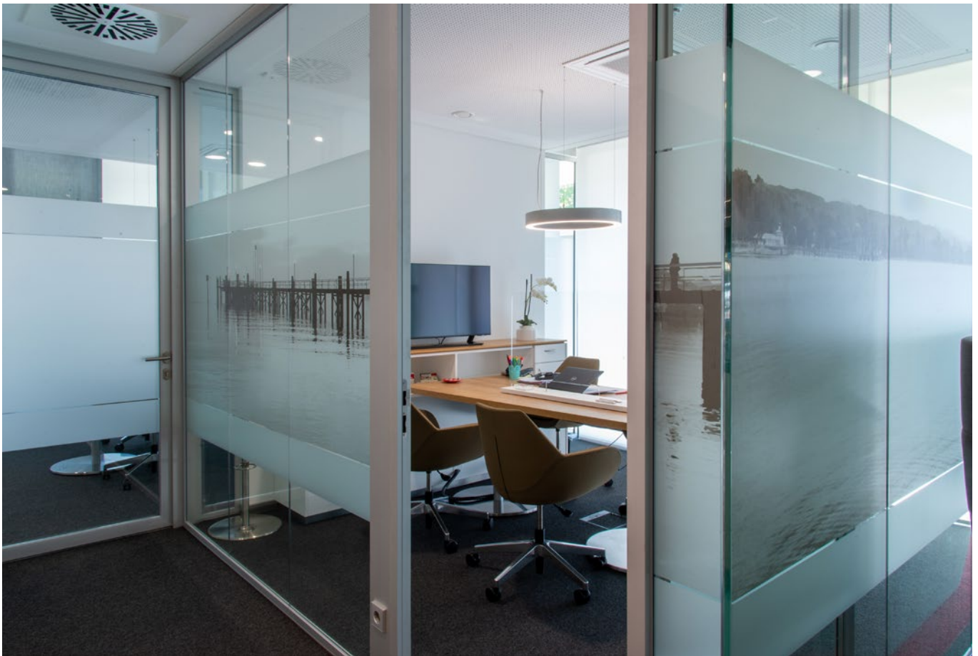
Blick in einen frei buchbaren Raum für persönliche und digitale Beratungen