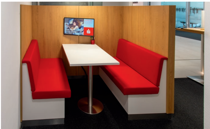
Diskrete Kurzberatung in der Servicewelt