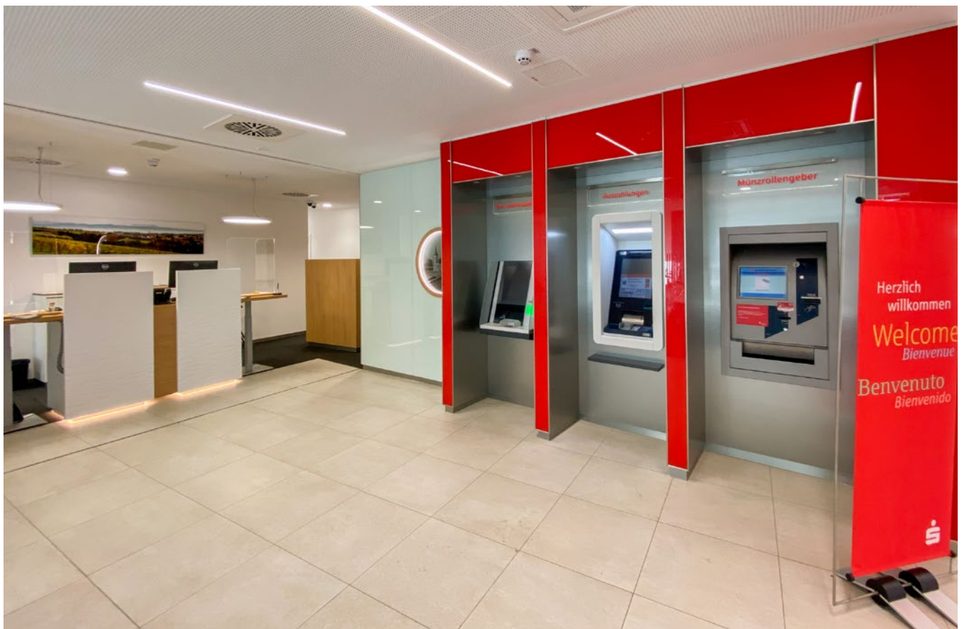
In den Servicebereich integriert: die SB-Automaten-Wand